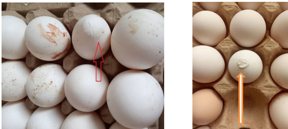
1-расм. Тухум пучоғининг минералланишларидаги бузилишлари.

Текширишлар давомида тухум берадиган товуқларнинг клиник кўрсаткичлари пульс ва нафаснинг тезлашиши яъни текширишлар бошидаги кўрсаткичларга нисбатан бир дақиқадаги нафас сонининг биринчи гуруҳда ўртача 3,0 мартага, иккинчи гуруҳда 2,0 мартагача, учинчи гуруҳда 3,0 мартагача ошганлиги аниқланди, шунга мос равишда юрак уришининг 3,0; 2,0 ва 1,0 мартага ошганлиги аниқланди.