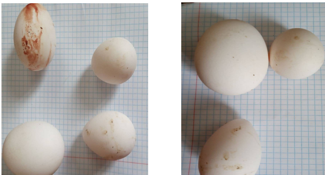
2- расм. Бир хил ёшдаги ва бир хил озиклантириш шароитида сақланган товуклар тухумининг катта кичиклигидаги фарқлар

Хулоса. Тухум йўналишидаги товукларда минераллар алмашинуви бузилишлари уларда иштаҳанинг пасайиши, ориқлаш, патларнинг хурпайиши ва тушиши, товукларнинг бир-бирини патларини ейиши, тож ва сирғалар рангининг оқариши, тухумлар вазнининг улар ёшига мос келмаслиги, юпқа пўчокли ёки пўчоксиз бўлиши, шаклининг ўзгариши ҳамда тухум маҳсулдорлигининг 20-30 % га камайиши билан кечади.